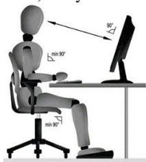
Rysunek 7. Przykład prawidłowo dostosowanego stanowiska komputerowego.