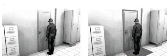
Rysunek 4. Przykład zastosowania pasów do oznaczenia drzwi nieprzeźroczystych. Na podstawie ramowych wytycznych z dnia 14.12.2020 r. [29]