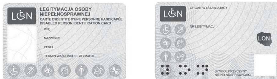
Rysunek 1. Legitymacja osoby niepełnosprawnej – wzór

ID card of a disabled person – template,