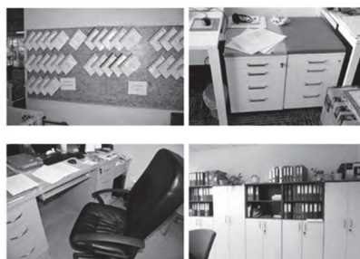
Rysunek 6. Przykład zróżnicowania kolorystycznego wyposażenia na stanowisku pracy. Na podstawie ramowych wytycznych – dobrych praktyk z dnia 20.12.2020 r. [29]

Adaptacja stanowiska pracy bezpośrednio powinna odnosić się do przestrzeni pracy w tym przypadku można przeprowadzić reorganizację stanowiska pracy w części biurowej magazynu. Wprowadzenie zmian na analizowanym stanowisku pracy powinno dotyczyć również kolorystycznego zróżnicowania wyposażenia miejsca pracy. Takie usprawnienia w znacznym stopniu przyczynią się do lepszej organizacji pracy. Inne zmiany dotyczące przestrzeni pracy powinny obejmować obramowania szaf, regałów, włączników światła, kontaktów, powierzchni siedziska krzesła i blatu stołu, różnobarwnych segregatorów i teczek – przypisując określonej barwie konkretną tematykę dokumentów, różnobarwnych spinaczy, długopisów, nożyczek. W przypadku osób słabowidzących zaleca się, aby elementy wyposażenia stanowiska pracy zawsze znajdowały się w stałym miejscu. Taka organizacja pracy przyczynia się do utrzymania porządku na stanowisku pracy i zapobiega zbędnym poszukiwaniom danego wyposażenia.