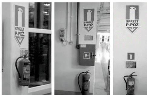
Rysunek 5. Przykład zastosowania znaków bezpieczeństwa w miejscach umieszczenia środków ochrony przeciwpożarowej. Na podstawie ramowych wytycznych – dobrych praktyk z dnia 14.12.2020 r. [29]

W ramach propozycji wdrożenia zaleca się umieścić duże i czytelne znaki bezpieczeństwa, które pomogą w lokalizacji środków ochrony przeciwpożarowej. Takie rozwiązanie w znacznym stopniu ułatwi osobie słabowidzącej zlokalizowanie w razie potrzeby tych środków.